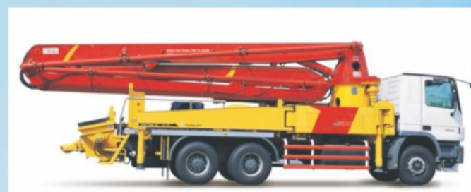
工程机械 Construction Machinery