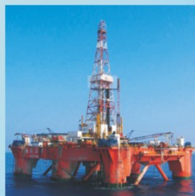
石油化工 Oil Chemical