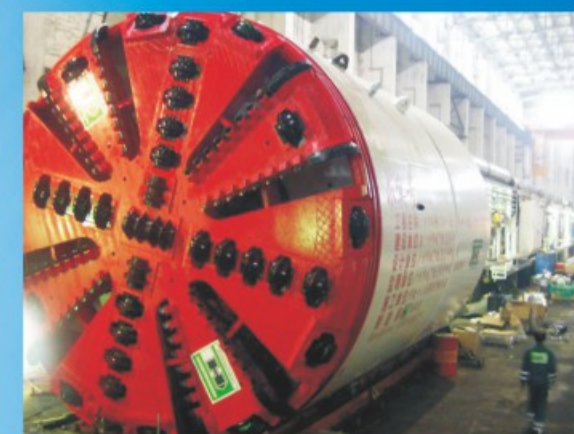
船舶盾构 Ship Tunnel