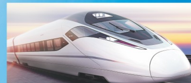
高铁动车 High-speed train