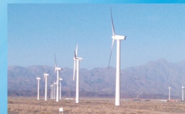
风力发电 Wind power generation