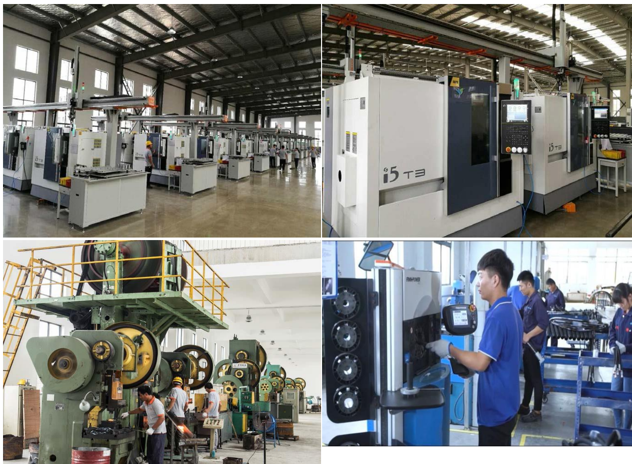
图 2 关键生产设备