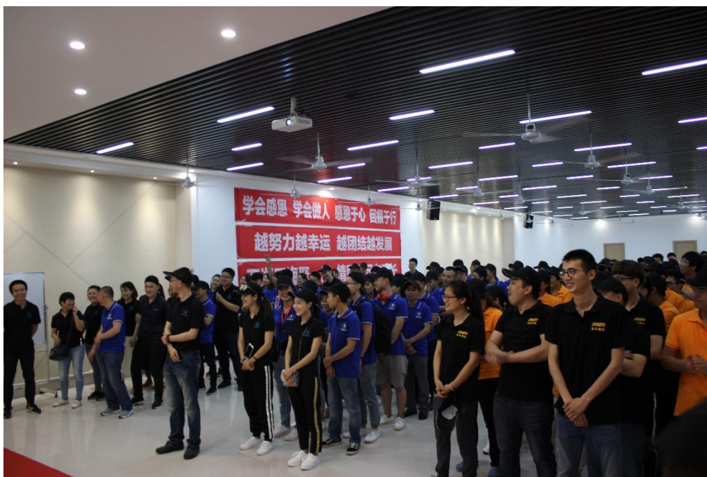
图 7 员工活动

公司每年均进行员工满意度抽样调查，通过发放员工满意度调查问卷、面谈、员工意见箱等方式收集员工信息，其中满意度调查内容从“培训与发展、工作环境、交流与信息、奖惩与福利、后勤服务”等方面展开，以此了解员工的意见和建议，并分析原因和制定整改措施，以提高员工的满意度。同时，公司每年对员工流失率、安全生产指标进行分析，并以此作为依据制定有针对性的整改措施，以保证员工的最基本利益。